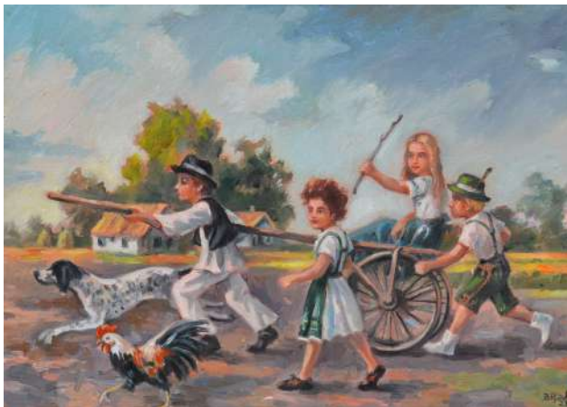
Veselé deti sa hrajú s károu (1936), olejomaľba, 70 x 50 cm, 2023