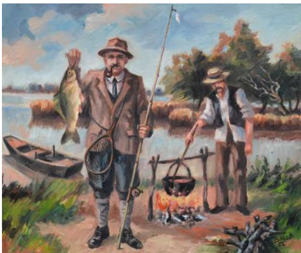
Đoka Dunderski u ribolovu (1940), ulje na platnu, 50 x 60 cm, 2023.