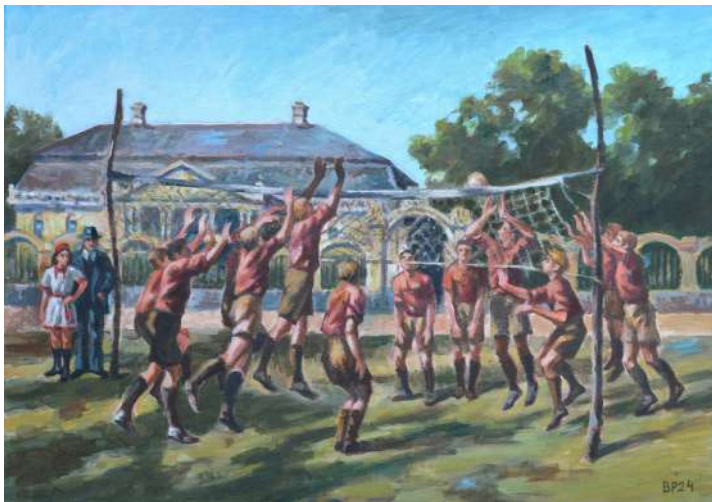
Doka Duñerski sa sokolima odbojkašima Kulpina (1937) , ulje na platnu, 70 x 50 cm, 2024.