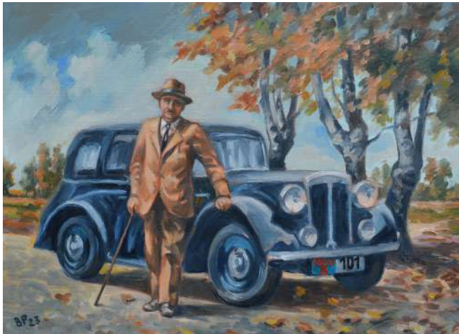
Đoka Dunderski pri aute (1941), olejomal'ba, 70 x 50 cm, 2023