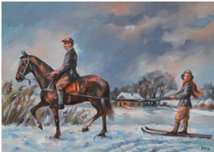
Đoka Dunderski a Kusika na lyžování (1939), olejomalba, 70 x 50 cm, 2023