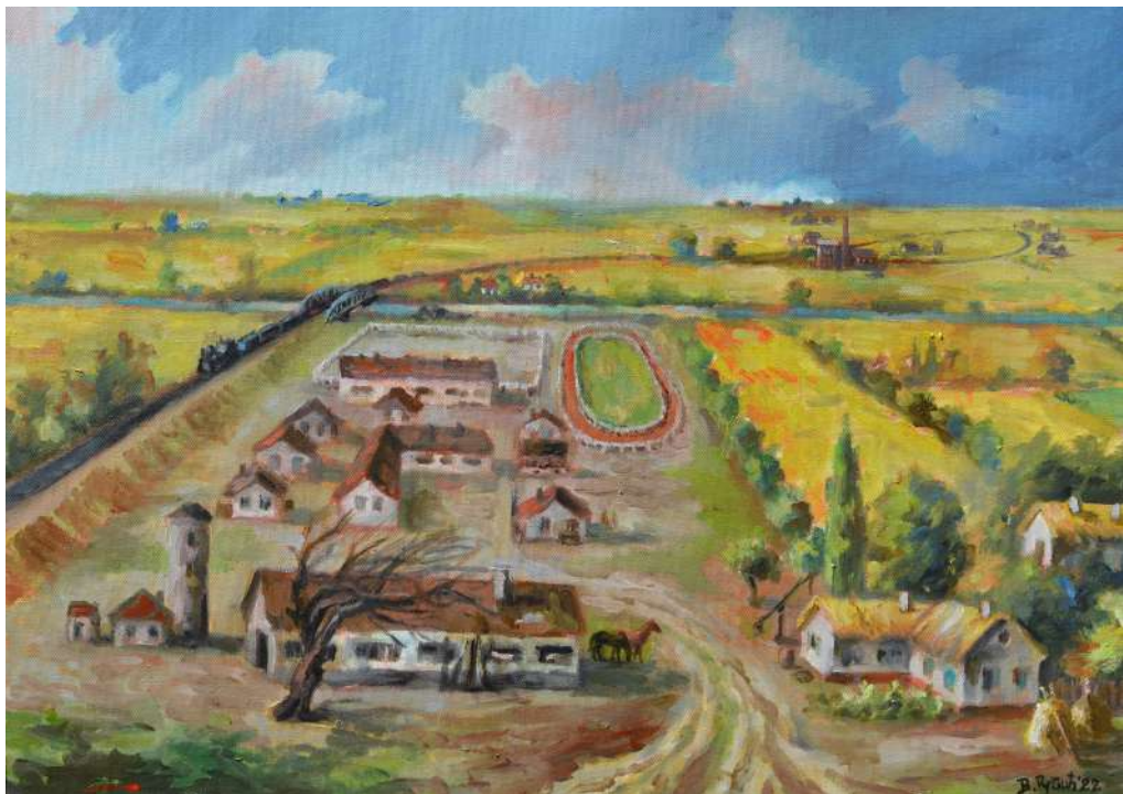
Žrebčín Kulpín Ďoke Dundeřského (1919) , olejomaľba, 70 x 50 cm, 2022