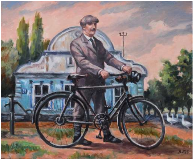
Đoka Dunderski kao biciklista (1940), ulje na platnu, 60 x 50 cm, 2023.