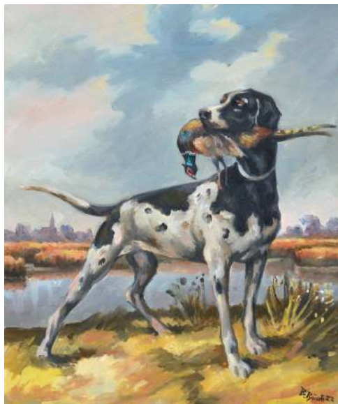
Obľúbený Ďokov pes Artemis na poľovačke (1927),