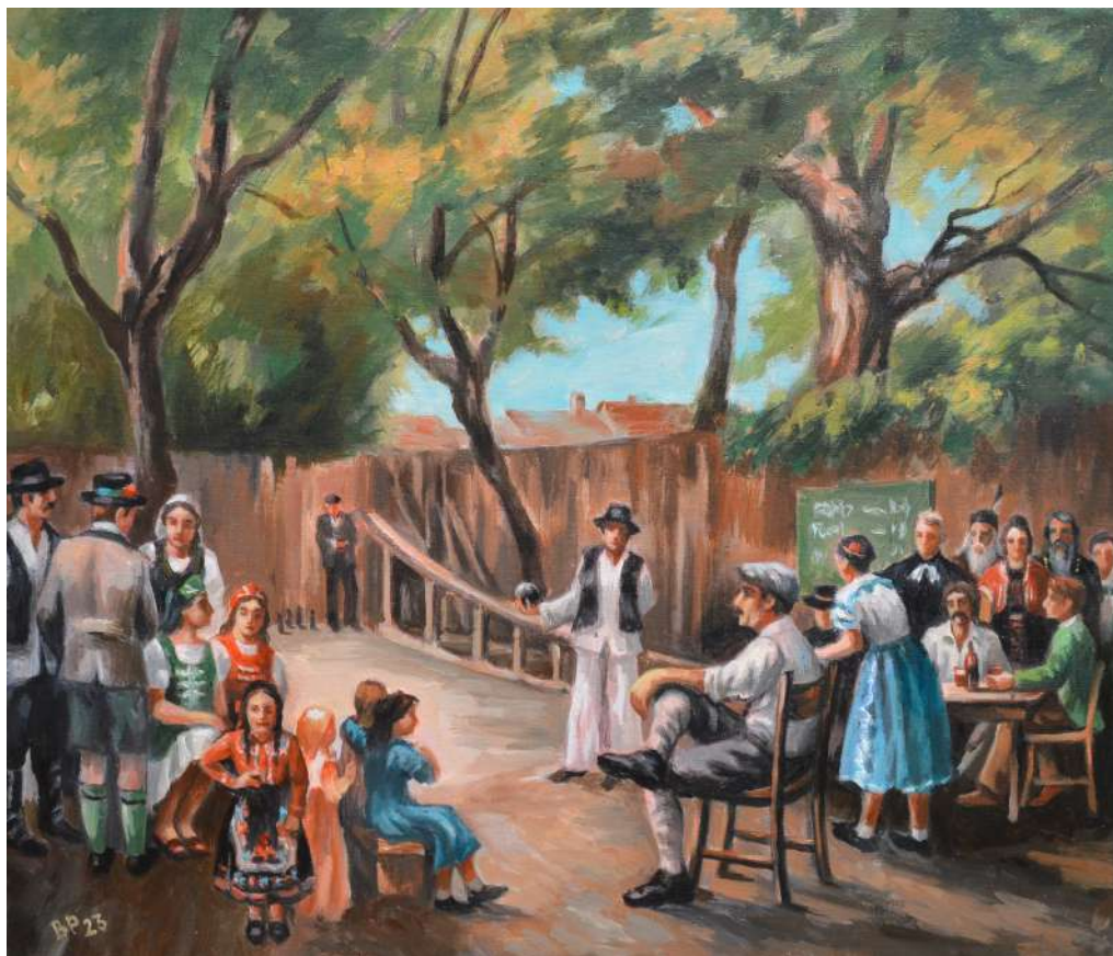
Doka Dundeški s členmi KUS Kulpín hrá kolký (1929) , olejomalba, 70 x 60 cm, 2023