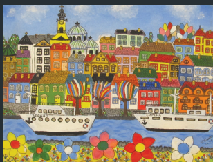
Vlasta Triašková (B. Petrovec)