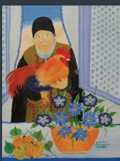
Zuzana Pudelková (Pivnica)