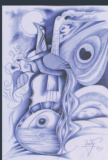
Juraj Berédi (Selenča)