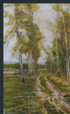
Savo Spremo (Maglič)