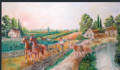
Michal Virág (Kulpín)