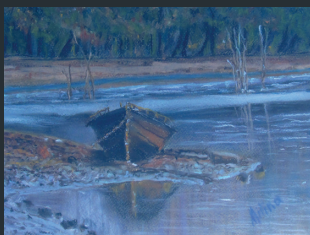
Milina Balážová (Hložany)