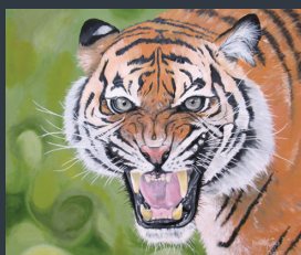
Miro Horvát (Kulpín)